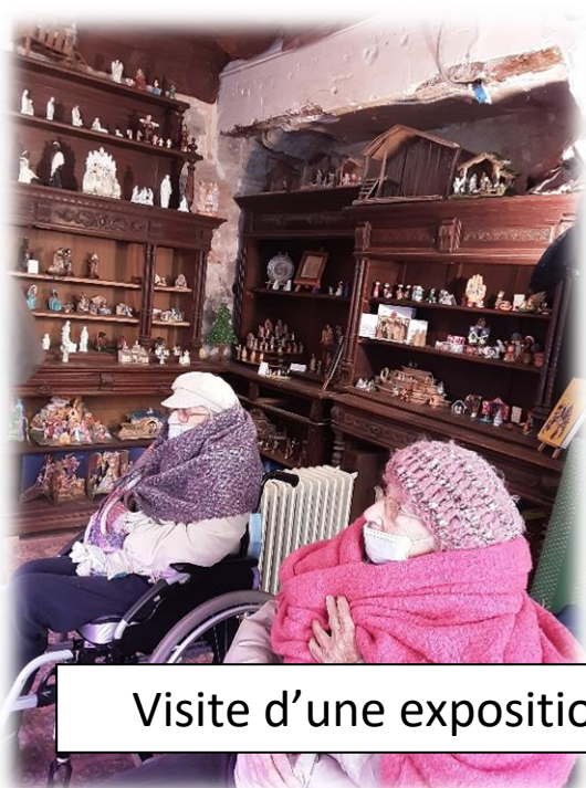
Visite d'une exposition de crèches au coeur du village