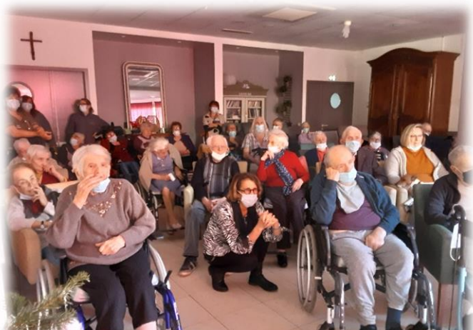
Spectacle de magie pour nous envoler vers Noël...