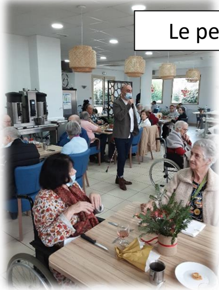
Le petit mot du Directeur