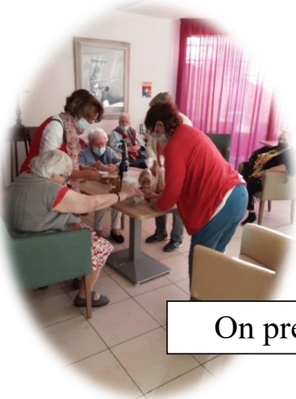
On prépare nos expéditions...