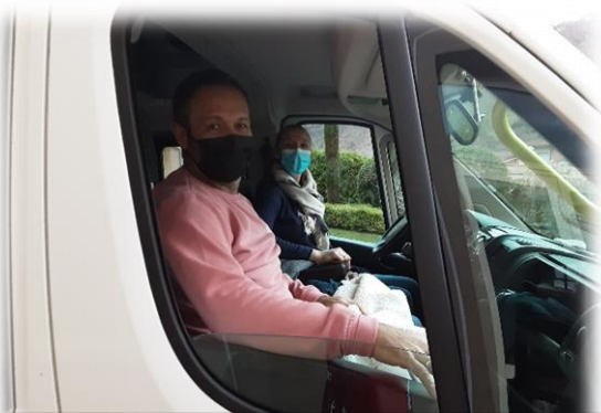
Toute première sortie à bord de notre nouveau minibus. En route pour les quartiers illuminés de Millau!