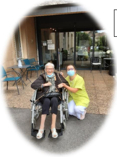
Promenades au village