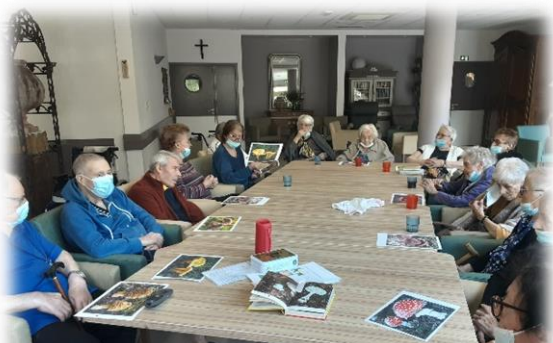
Souvenirs de cueillette de champignons