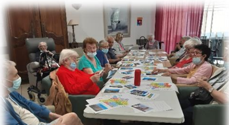
Atelier sur le patrimoine de la France