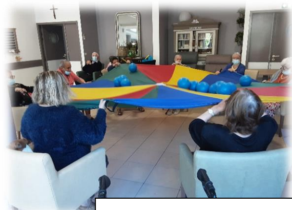
Unissons le rire et le sport