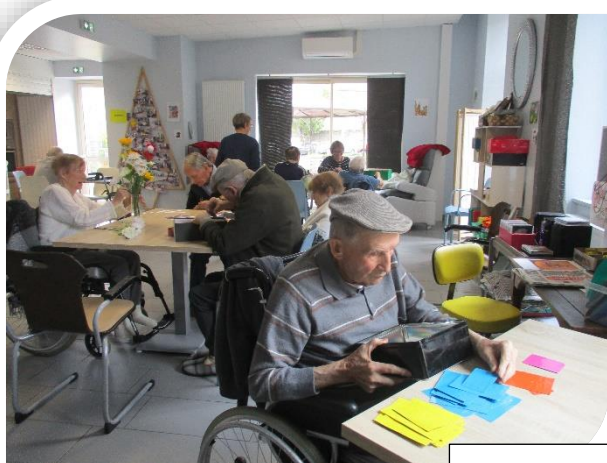
Préparation de décoration à l'approche des fêtes.