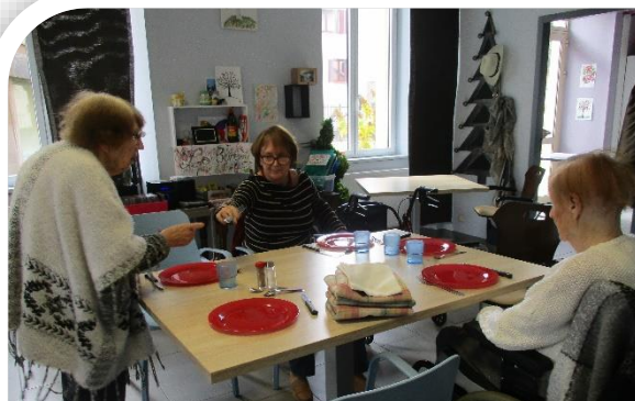
Avant le repas, ces dames mettent la table...