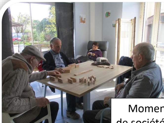
Moments de convivialité autour de jeux de société...