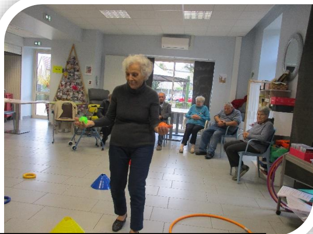
Un peu d'exercice pour rester en forme...