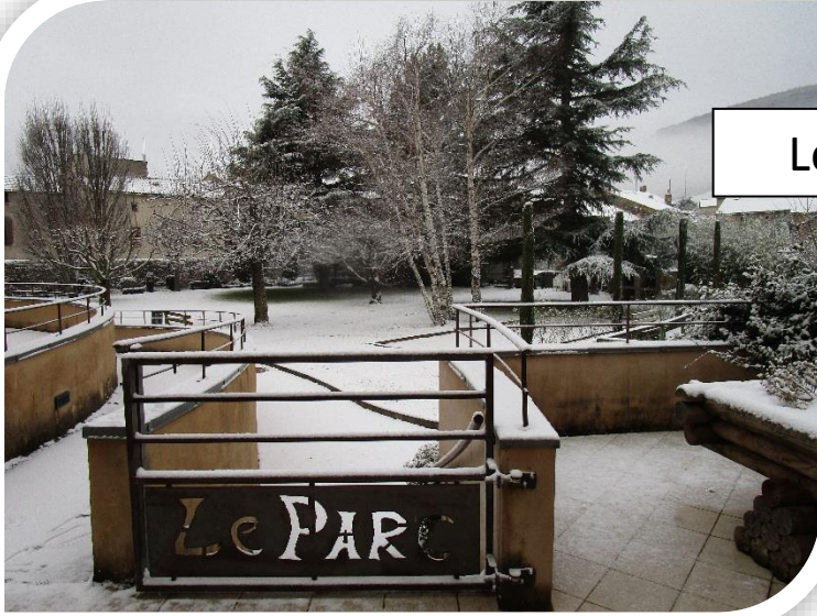
Le 23 janvier, jour de neige...